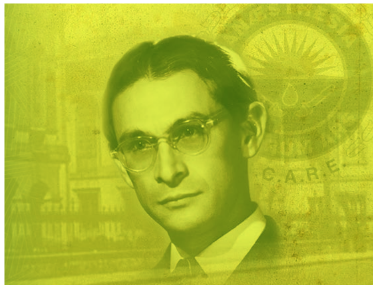
CONCURSO JUAN MARÍN

Anestesia y cuidado Perioperatorio Soluciones ante los nuevos desafíos naturales, sociales y personales